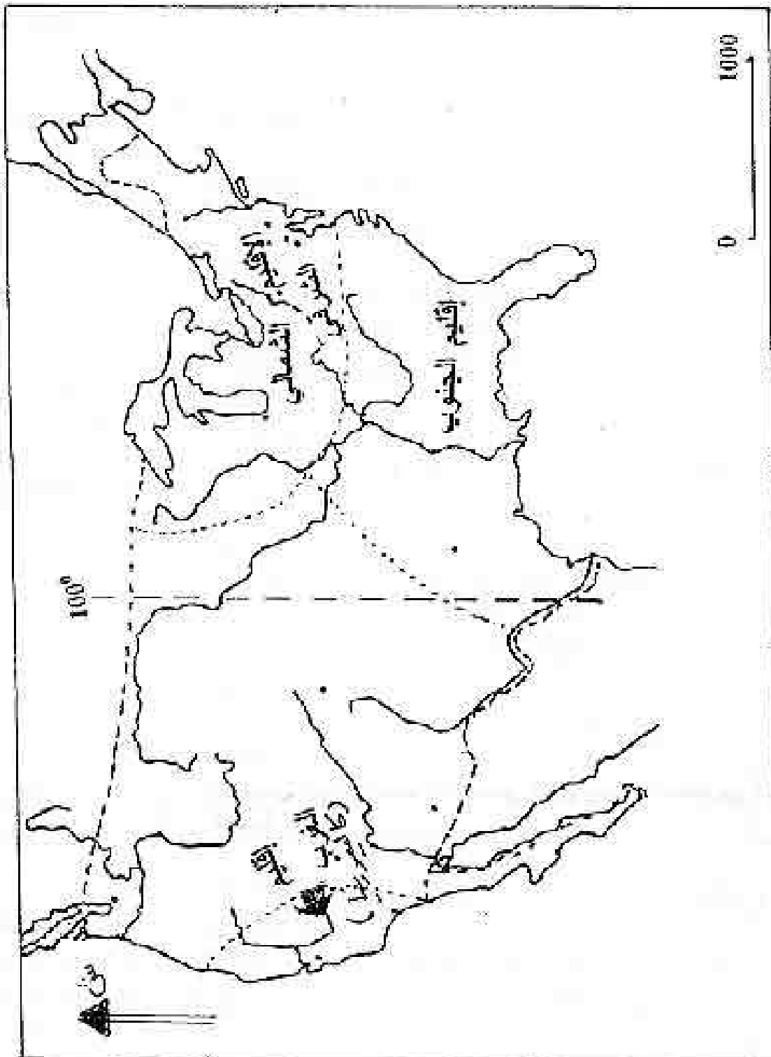
الإقليم الصناعي الكبرى في الولايات المتحدة الأمريكية