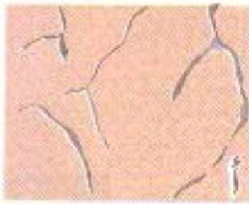
- أ -