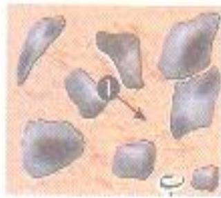
- ب -