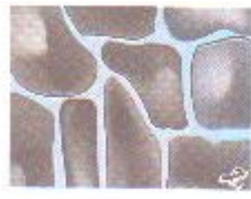
- ج -